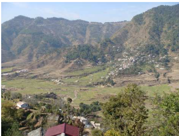
Omgeving van Pauri en de toekomstige WFC-campus