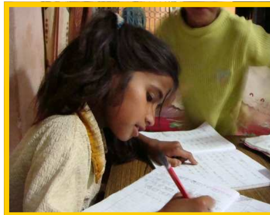
... op school