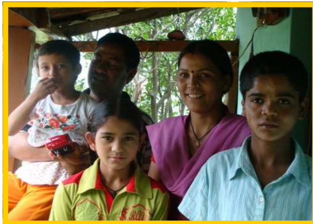
... en hier met de rest van de familie.