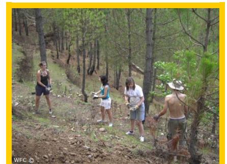
Werken aan de ommuring van het WFC-terrein