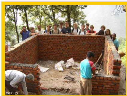
Een nieuwe tempel bouwen voor de lokale gemeenschap van Pauri