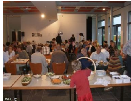
sympathisanten op onze tweede BBQ